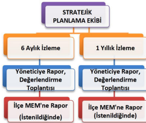
Şekil 2 Stratejik Plan İzleme ve Değerlendirme Modeli

Müdürlüğümüzün 2024-2028 Stratejik Planı İzleme ve Değerlendirme sürecini ifade eden İzleme ve Değerlendirme Modeli hazırlanmıştır. Okulumuzun Stratejik Plan İzleme-Değerlendirme çalışmaları eğitim-öğretim yılı çalışma takvimi de dikkate alınarak 6 aylık ve 1 yıllık sürelerde gerçekleştirilecektir. 6 aylık sürelerde Okul Müdürüne rapor hazırlanacak ve değerlendirme toplantısı düzenlenecektir. İzleme-değerlendirme raporu, istenildiğinde İlçe Milli Eğitim Müdürlüğüne gönderilecektir.